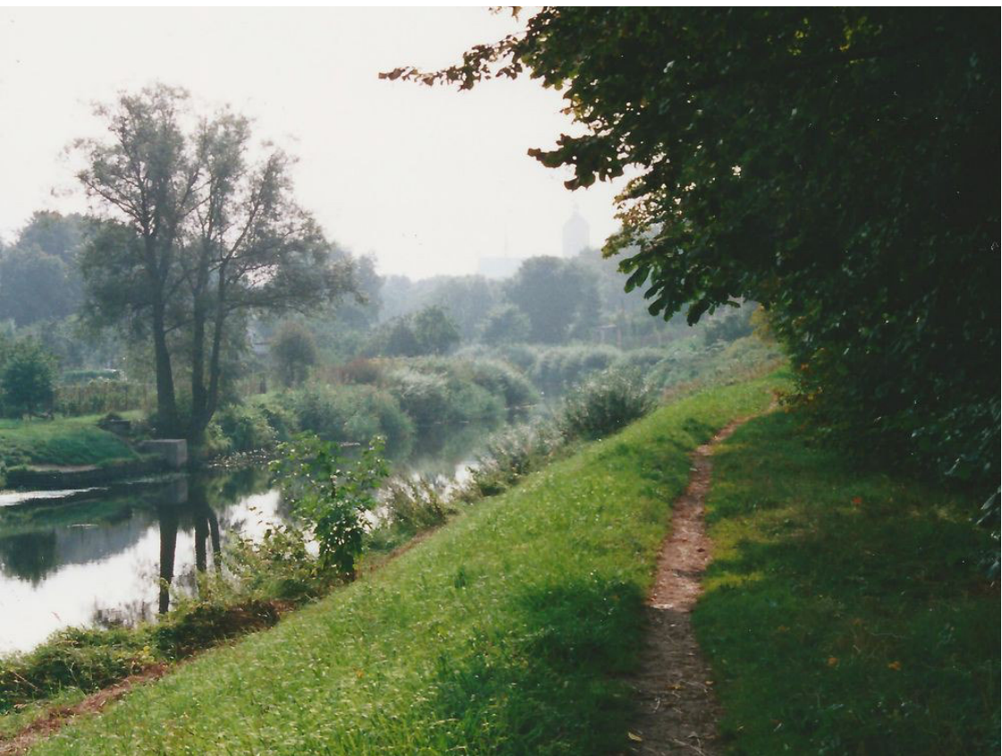
Pfad an der Passarge